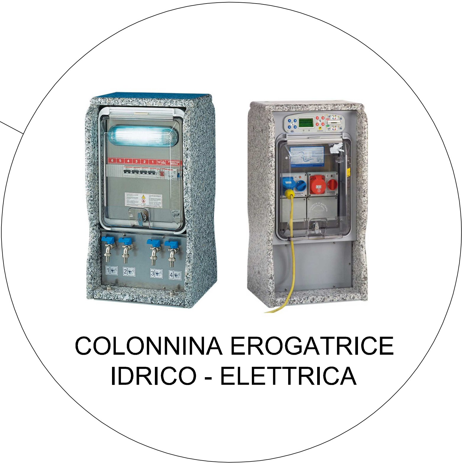
COLONNINA EROGATRICE IDRICO - ELETTRICA